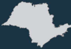
Participação do emprego formal em relação ao total do estado na fabricação de celulose, papel e produtos de papel 2017